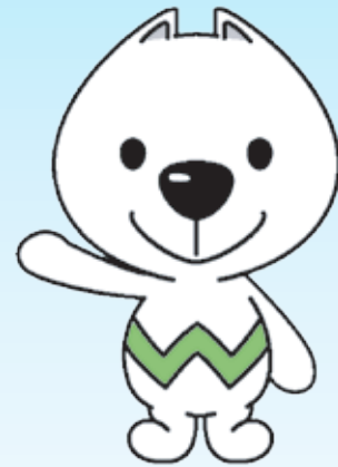
和歌山県PRキャラクター「さいちゃん」