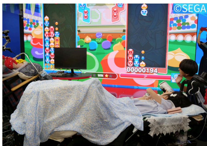
パレスポーツ・フェスタ～インクルーシブ・テックで遊ぼう！ IN TUNNEL TOKYO での様子

アシスティブ・テクノロジー（支援技術）は、障害のある方々の生活を豊かにし「できる」を広げる可能性を秘めています。しかし、デジタルディバイドにより、その可能性に気づかず諦めてしまう方も少なくありません。社会保障の枠にとらわれず、一人ひとりの「やりたい」を支える事業を展開。支援事業所や学校、保健所などと連携しながら、作業療法士としての専門性と創造性を活かした実践を紹介します。